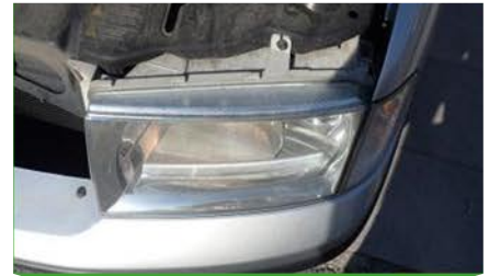
(opțional / obligatorii dacă se constată avarii)