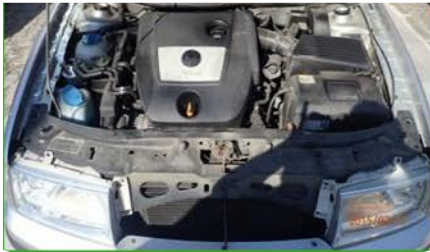
(opțional/ obligatorii dacă se constată avarii)

5. Fotografii ale compartimentului motor (opțional) cu accent pe faruri, dacă se constată avarii.