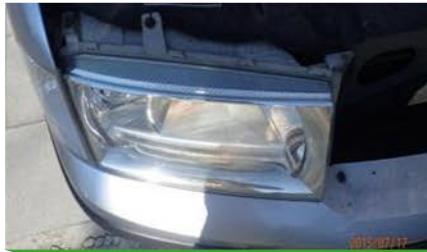
(opțional/ obligatorii dacă se constată avarii)